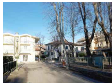
PUNTO DI SCATTO FOTOGRAFICO 02