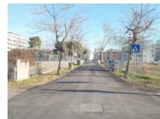
PUNTO DI SCATTO FOTOGRAFICO 06