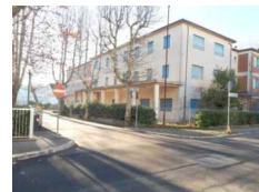
PUNTO DI SCATTO FOTOGRAFICO 09