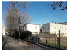
PUNTO DI SCATTO FOTOGRAFICO 03