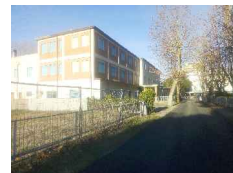
PUNTO DI SCATTO FOTOGRAFICO 08