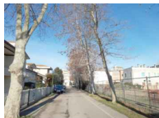
PUNTO DI SCATTO FOTOGRAFICO 04