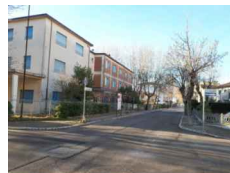
PUNTO DI SCATTO FOTOGRAFICO 10