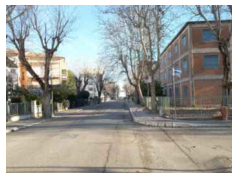
PUNTO DI SCATTO FOTOGRAFICO 01

PROGETTO DEFINITIVO DOCUMENTAZIONE FOTOGRAFICA