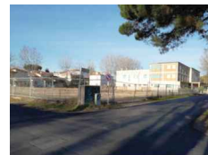
PUNTO DI SCATTO FOTOGRAFICO 07