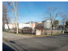
PUNTO DI SCATTO FOTOGRAFICO 05